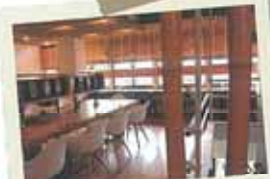
ナチュラルで和の雰囲気が落ち着く明るい店内