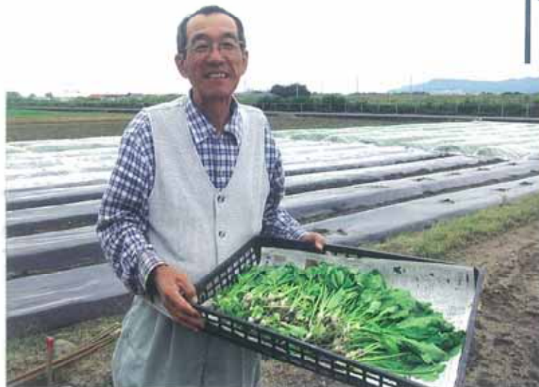
あいさい農園の目印