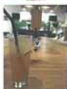
無添加のジンジャーエール