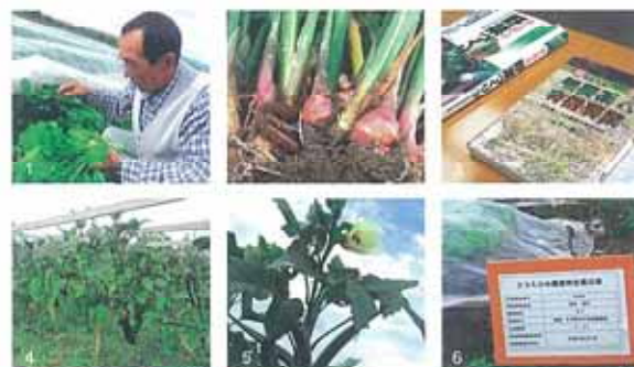
1 不織布をかけ、害虫から野菜を守る 2 金時しょうがとミミズ 3 農業のお手本 4 そろそろナスもおしまい 5 おくらの花 6 エコえひめ認証の表示(農業・化学肥料不使用)